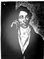
C. M. von Weber

Van Schubert hoort U de ouverture Rosamunde. Eigenlijk is dit niet de echte Rosamunde-ouverture. De muziek die U hoort is in 1820 gecomponeerd voor een melodrama "De Toverharp". Wij kennen deze muziek echter nu als de ouverture "Rosamunde". Van Brahms hoort U de Akademische Festouvertüre.